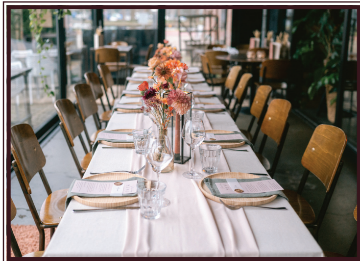
Bloemen: Flora Lisa, Styling: Binnenstebuiten Events

Van private dining tot vergaderen en van bedrijfsfeest tot bruiloft. Voor iedere gelegenheid denken we graag mee en maken we speciaal voor jou een geweldig voorstel!